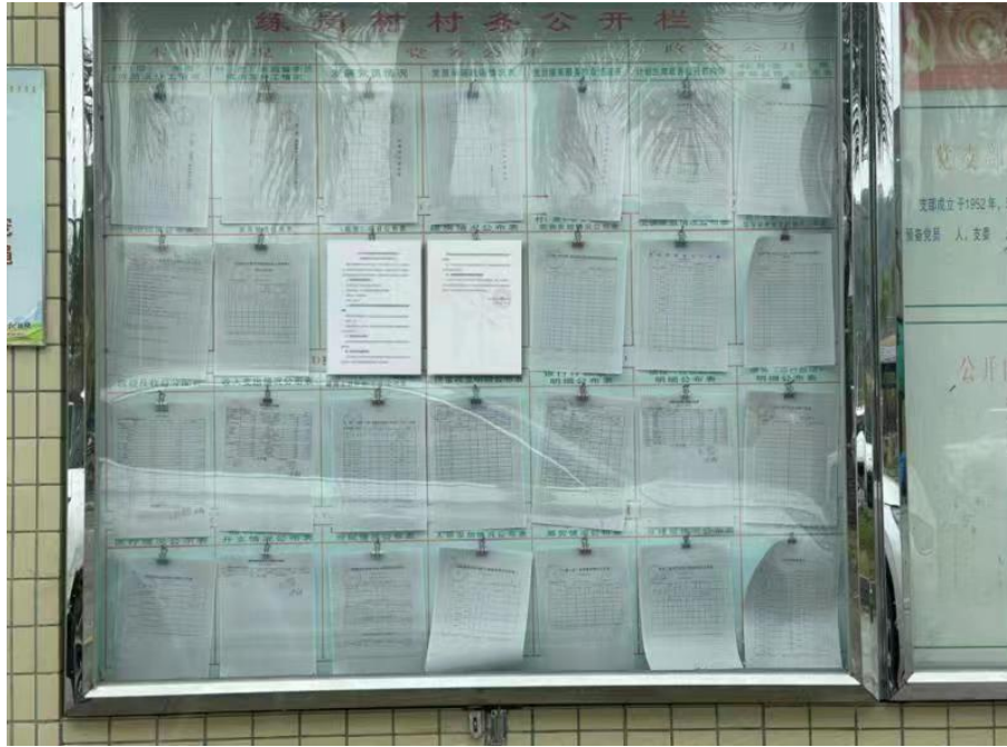
图 2-5 (a) 张贴公告