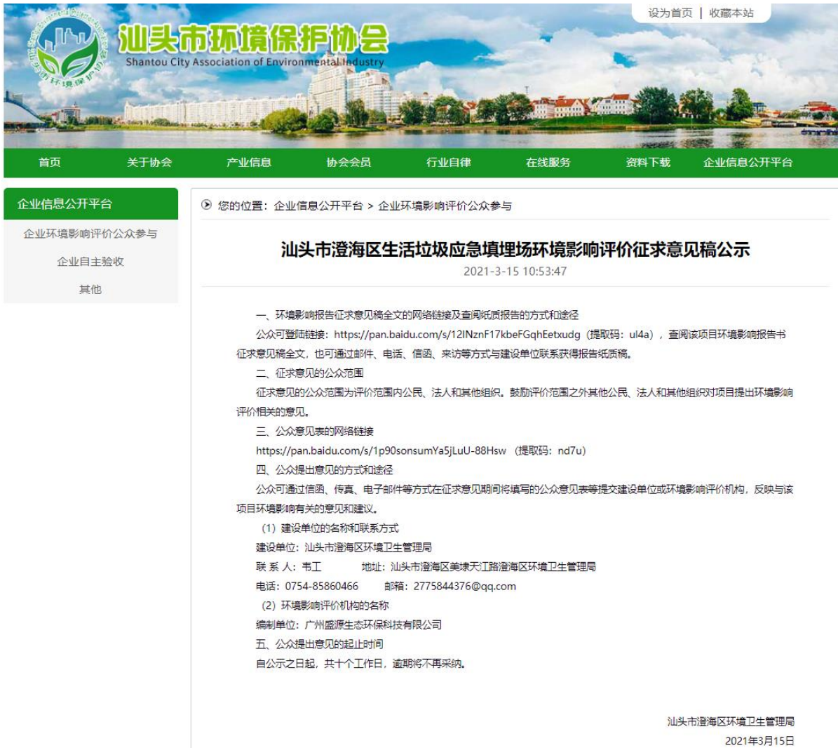
图 3-1 征求意见稿网络公示情况