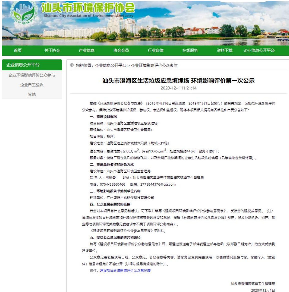
图 2-1 环境影响评价第一次公示网络截图